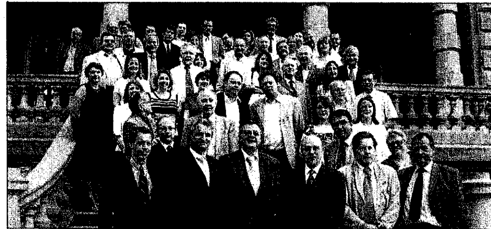
Sur les marches du château de la Casc.

La commission de travail franco-allemande a organisé, mercredi 6 juin à l'hôtel de la CASC, une conférence qui a réuni les avocats frontaliers, français et allemands.